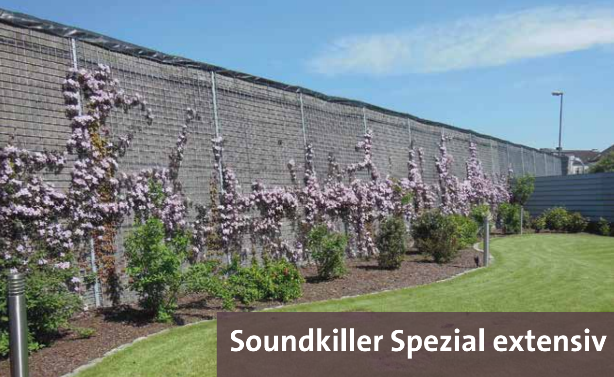
Soundkiller Spezial extensiv

Unser flexibles Lärmschutzsystem Soundkiller bieten wir in zwei Varianten an: Soundkiller Spezial extensiv und Soundkiller intensiv . Soundkiller ist beidseitig hochabsorbierend und durch die dichte Bepflanzung besonders ungeeignet für Graffiti.